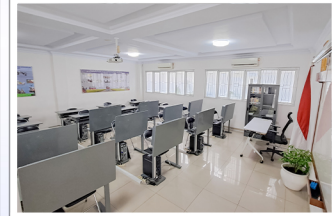
RUANG LAB. KOMPUTER