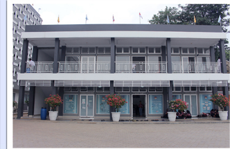
GEDUNG WORKSHOP & BUSINESS CENTER