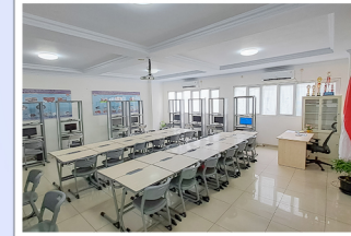
RUANG LAB. MIKROTIK