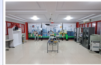
RUANG LAB INDUSTRI TELKOM