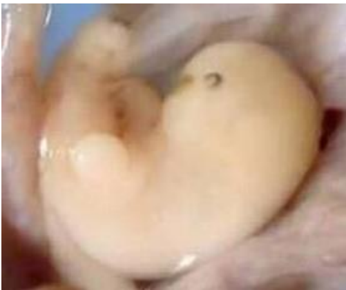
Gambar 2: mudhghoh (segumpal daging) usia 2 Bulan

Ulama' fiqih berbeda pendapat dalam masalah ini: